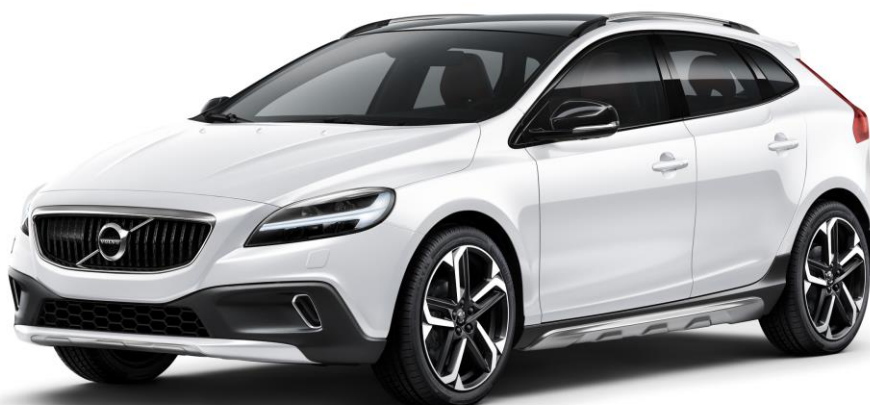
V40 Cross Country D4 Aktiv Edition

ボルボ・カー・ジャパン株式会社(代表取締役社長:木村隆之、本社:東京都港区)は、150台限定の特別限定車「V40 Cross Country D4 Aktiv(アクティブ) Edition」を、本日より販売いたします。